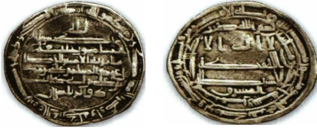
ضرب مرو - ٢٠١ هـ.ق.

رو: لا اله الا الله / وحده لا شريك له / المشرق / بسم الله / ضرب هذا الدرهم بمرو سنة احدى و مائتين / لله الامر من قبل و من بعد و يومئذ يفرح المؤمنون بنصر الله. پشت: لله / محمد رسول الله / المأمون خليفة الله / مما امر به الامير الرضا ولى عهد المسلمين على بن موسى بن على بن ابى طالب / ذوالرياستين / محمد رسول الله ارسله بالهدى و دين الحق ليظهره على الدين كله ولو كره المشركون.