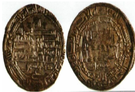
اصفهان - ضرب ۲۰۳ هـ.ق.

پشت: لله / محمد رسول الله / المأمون خليفة الله / مما امر به الامير الرضا ولي عهد المسلمين على بن موسى بن علي بن ابي طالب / ذوالرياستين / محمد رسول الله ارسله بالحق و دين الحق ليظهره على الدين كله ولو كره المشركون.