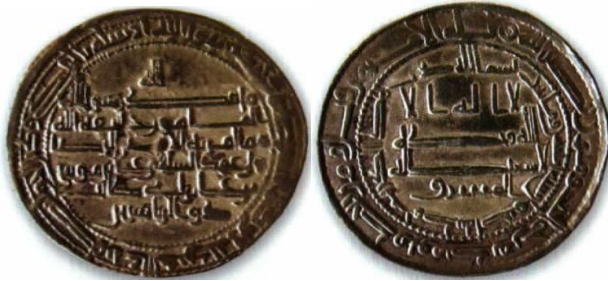
ضرب اصفهان - ٢٠٢ هـ.ق.

رو: لا اله الا الله / وحده لا شريك له / المشرق / بسم الله / ضرب هذا الدرهم بمرو سنة احدى و مائتين / لله الامر من قبل و من بعد و يومئذ يفرح المؤمنون بنصر الله. پشت: لله / محمد رسول الله / المأمون خليفة الله / مما امر به الامير الرضا ولى عهد المسلمين على بن موسى بن على بن ابى طالب / ذوالرياستين / محمد رسول الله ارسله بالهدى و دين الحق ليظهره على الدين كله ولو كره المشركون.