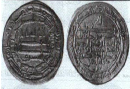
ضرب اصفهان - ۲۰۵ هـ.ق.

رو: لا اله الا الله / وحده لا شريك له / المشرق / بسم الله / ضرب هذا الدرهم بمدينة اصبهان سنة خمس و مائتين / لله الامر من قبل و من بعد و يومئذ يفرح المؤمنون بنصر الله.