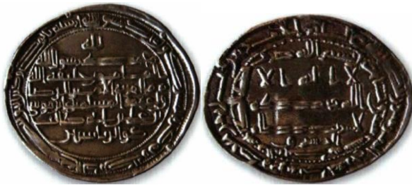
ضرب محمدیه - ۲۰۲ ه.ق.

پشت: لله / محمد رسول الله / المأمون خليفة الله / مما امر به الامير الرضا ولى عهد المسلمين على بن موسى بن على بن ابى طالب / ذوالرياستين / محمد رسول الله ارسله بالهدى و دين الحق ليظهره على الدين كله ولو كره المشركون.