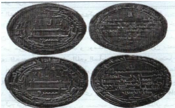
ضرب اصفهان - ۲۰۳ هـ.ق.

رو: لا اله الا الله / وحده لا شريك له / المشرق / بسم الله / ضرب هذا الدرهم بمدينة اصفهان سنة ثلاث و مائتين / لله الامر من قبل و من بعد و يومئذ يفرح المؤمنون بنصر الله.