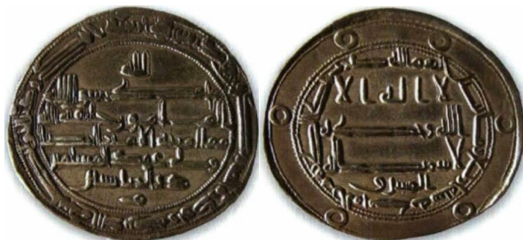
ضرب محمدیه - ۲۰۴ ه.ق.

رو: لا اله الا الله / وحده لا شریک له / المشرق / بسم الله / ضرب هذا الدرهم بالمحمدية سنة اربع و مائتين / لله الامر من قبل و من بعد و يومئذ يفرح المؤمنون بنصر الله.