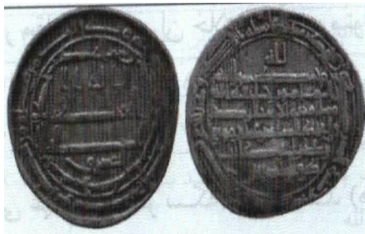
ضرب سمرقند - ۲۰۳ هـ.ق.

پشت: لله / محمد رسول الله / المأمون خليفة الله / مما امر به الامير الرضا ولي عهد المسلمين على بن موسى بن علي بن ابي طالب / ذوالرياستين / محمد رسول الله ارسله بالهدى و دين الحق ليظهره على الدين كله ولو كره المشركون.