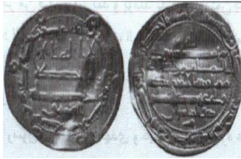
ضرب محمدیه - ٢٠٤ هـ.ق.

پشت: لله / محمد رسول الله / المأمون خليفة الله / مما امر به الامير الرضا ولى عهد المسلمين على بن موسى بن على بن ابى طالب / ذوالرياستين / محمد رسول الله ارسله بالحدى و دين الحق ليظهره على الدين كله ولو كره المشركون.