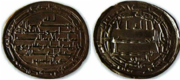
ضرب سمرقند - ۲۰۲ ه.ق.

رو: لا اله الا الله / وحده لا شريك له / المشرق / بسم الله / ضرب هذا الدرهم بسمرقند سنة اثنتين و مائتين / لله الامر من قبل و من بعد و يومئذ يفرح المؤمنون بنصر الله.