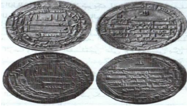
ضرب اصفهان - ٢٠٤ هـ.ق.

رو: لا اله الا الله / وحده لا شريك له / المشرق / بسم الله / ضرب هذا الدرهم بمدينة اصبهان سنة اربع و مائتين / لله الامر من قبل و من بعد و يومئذ يفرح المؤمنون بنصر الله.